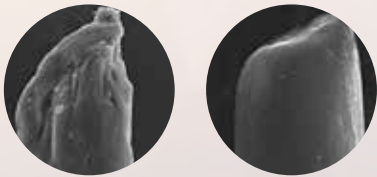
ohne OLAPLEX® mit OLAPLEX®

OLAPLEX® ist frei von Silikonen, Sulfaten, Phthalaten, DEA, Aldehyden und Gluten. OLAPLEX® wurde nie an Tieren getestet.